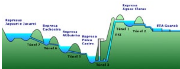
Figura 1- Perfil esquemático do Sistema Cantareira

Desenvolvimento Global dos Recursos Hídricos das Bacias do Alto Tietê e Cubatão- Plano Diretor de Obras (DAEE 1968), elaborado sob a responsabilidade do Departamento de Águas e Energia Elétrica e pelo um Consorcio Hibrace, constituído por três firmas de Consultoria.. Este estudo caracterizou-se por uma abordagem ampla das questões de recursos hídricos das regiões do Alto Tietê, Baixada Santista e Bacia do Rio Piracicaba. Foram abordados o abastecimento de água, a questão da coleta, disposição e tratamento dos esgotos e o controle de cheias destas regiões . Foram ainda executados anteprojetos de inúmeras de obras para aquilatar questões de viabilidade técnica e econômica das alternativas concebidas. O relatório final dos estudos apontou o Sistema Cantareira, esquematizado na Figura 1, como prioritário para resolver os crônicos problemas de abastecimento de água da Região Metropolitana de São Paulo.