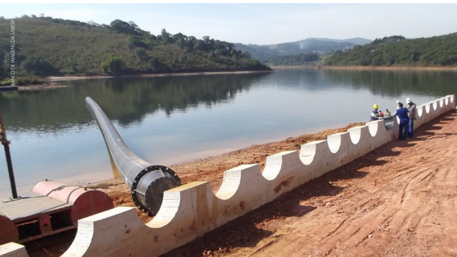
Figura 2 - Obras de instalação do bombeamento para captação de água do volume morto do Sistema Cantareira

O termo Volume Morto é corrente no campo da Engenharia de Barragens e significa, em termos amplos, que se trata de um volume que não é utilizado para as finalidades normais do reservatório. Dependendo de fatores como as finalidades do reservatório, sua topografia e o arranjo de suas estruturas o Volume Morto pode ficar em cotas elevadas, até mesmo nas proximidades do topo da barragem. Não existe nenhuma relação entre este termo técnico e coisa “morta”, “podre” ou de “má qualidade”. Trata-se, portanto, de um volume inativo, para os objetivos do reservatório, em condições