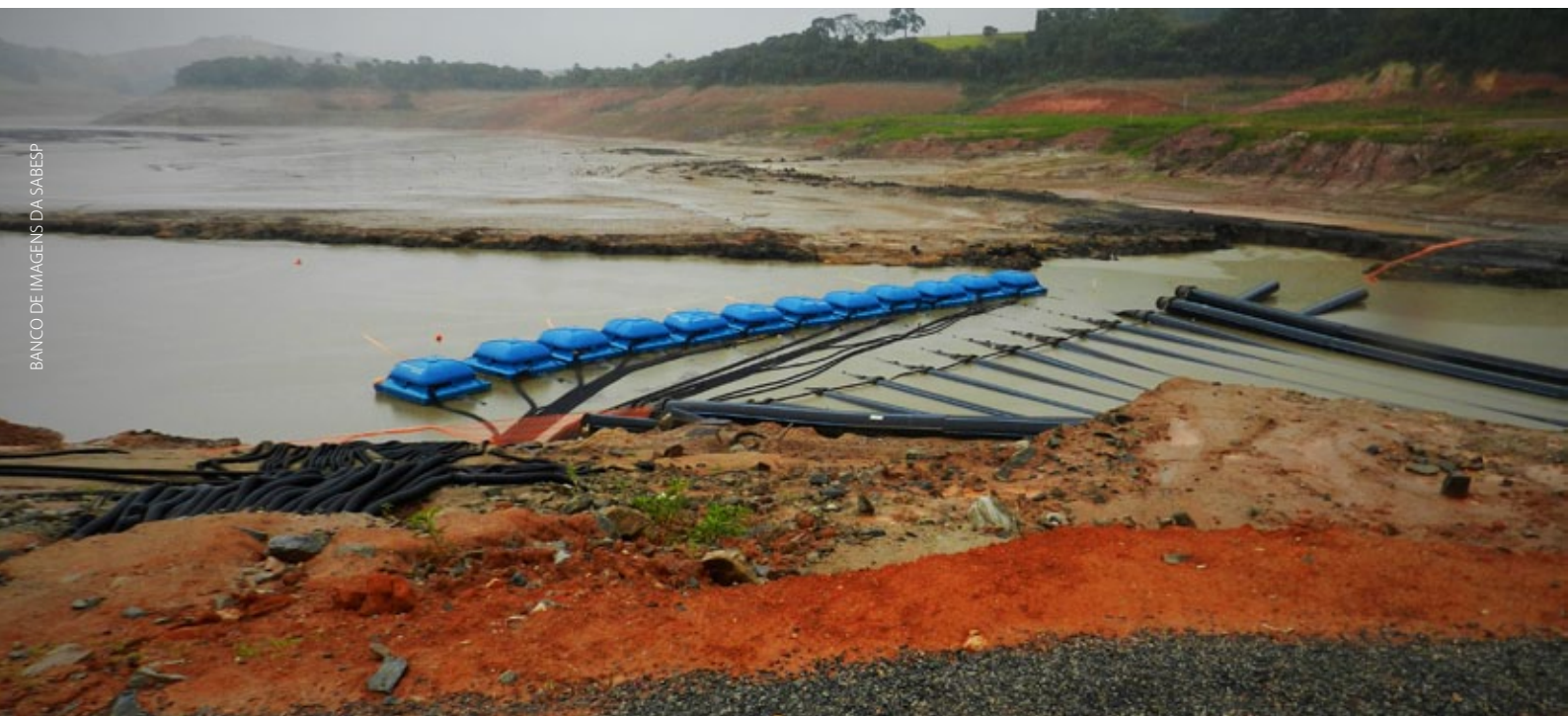
Figura 5 - Obras de instalação do bombeamento para captação de água do volume morto do Sistema Cantareira

- Após a captação nos reservatórios, a água bruta é transferida para a Estação de Tratamento de Água do Guaraú. A ETA-Guaraú produz água de abastecimento para ser distribuída à população em conformidade com o padrão de potabilidade estabelecido pelo Ministério da Saúde.